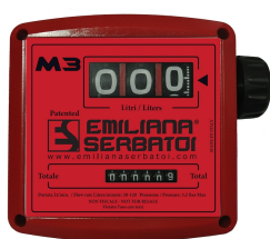
Contaltri meccanico per diesel K33