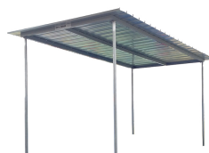
Tettoia Tank Fuel verticale mono parete

Per diesel. Assorbimento acqua e filtrazione impurità. Capacità filtrante 30µm. Portata 70 lt/min