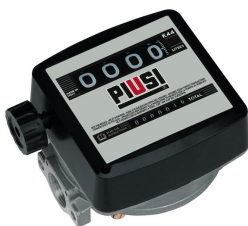
Contaltri meccanico K44