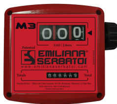
Contaltri meccanico per diesel K33