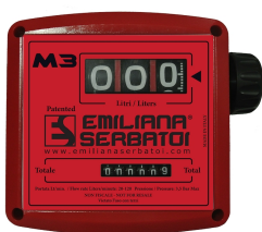
Contaltri meccanico per diesel K33