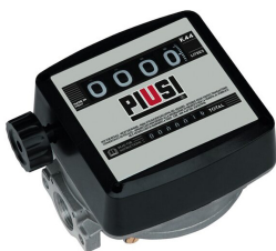
Contaltri meccanico K44