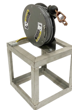
Arrotolatore del cavo di messa a terra