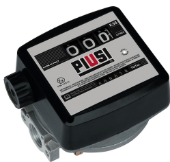
Contaltri meccanico per benzina K33 ATEX