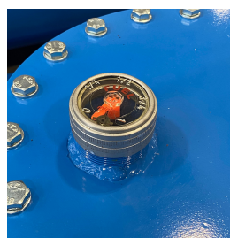
Indicatore di livello

Sistema di controllo remoto del livello di carburante presente nel serbatoio