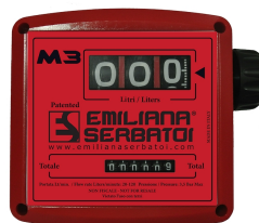
Contaltri meccanico per diesel K33