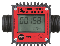
Contaltri digitale per diesel M24

Per diesel e benzina. Filtrazione impurità. Capacità filtrante 60µm. Portata 50 lt/min