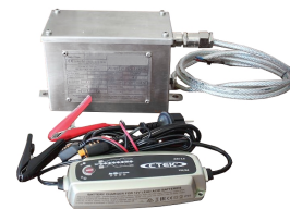
BATTERIA ATEX con carica batteria (presa europea tipo C)