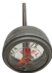
Indicatore di livello

Bacino di contenimento per uso temporaneo a terra, capacità pari al 100% del volume del serbatoio, realizzato in acciaio al carbonio.