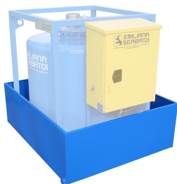
Bacino di contenimento per Traspo®

Bacino di contenimento per uso temporaneo a terra, capacità pari al 100% del volume del serbatoio, realizzato in acciaio al carbonio.