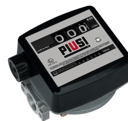
Contaltri meccanico per benzina K33 ATEX