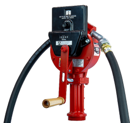
Contaltri per pompa rotativa manuale