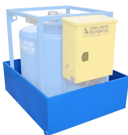
Bacino di contenimento per Traspo®

Bacino di contenimento per uso temporaneo a terra, capacità pari al 100% del volume del serbatoio, realizzato in acciaio al carbonio.