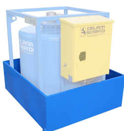
Bacino di contenimento per Traspo®

Bacino di contenimento per uso temporaneo a terra, capacità pari al 100% del volume del serbatoio, realizzato in acciaio al carbonio.