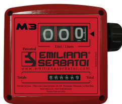
Contaltri meccanico per diesel K33