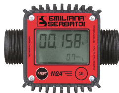
Contaltri digitale per diesel M24