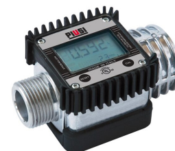
Contaltri digitale per benzina K24 ATEX