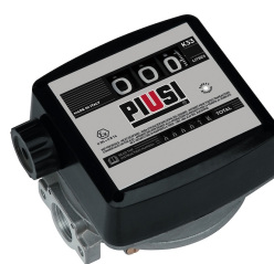
Contaltri meccanico per benzina K33 ATEX

Bacino di contenimento per uso temporaneo a terra, capacità pari al 100% del volume del serbatoio, realizzato in acciaio al carbonio.