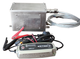
BATTERIA ATEX con carica batteria (presa europea tipo C)