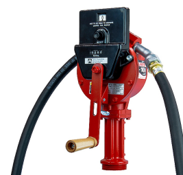
Contaltri per pompa rotativa manuale