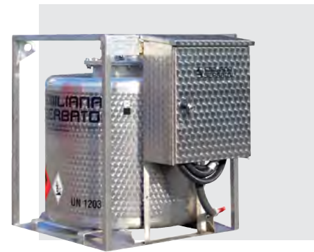
TFT 330 INOX: serbatoio in acciaio inox per trasporto carburanti.