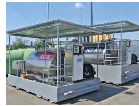
TFT 910 INOX: stainless steel tank for fuel transport.