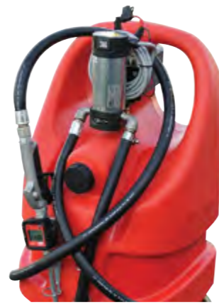
Disponibile anche per olio. Available for lubricants.

[EN] Polyethylene tank for Fuels (Gasoline, Diesel Fuel, Ethanol) transport, homologated in accordance with ADR regulation; available also the version in exemption from ADR in accordance with paragraph 1.1.3.1 C ADR.